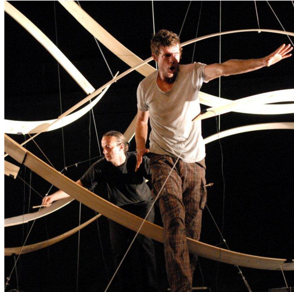
Grandeur Nature , Théâtre de Poitiers, 2013

Notre démarche artistique est plutôt basée sur la singularité que sur la virtuosité. Nous n'avons pas besoin que les apprenant.e.s disposent d'un bagage technique en danse, en sculpture, en musique, pour que nous réussissions à faire ensemble. Tout sera réalisé à partir de gestes simples que nous transmettrons aux apprenant.e.s.